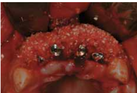
Relleno de los defectos vestibulares con Osteo-Biol Gen-Os.