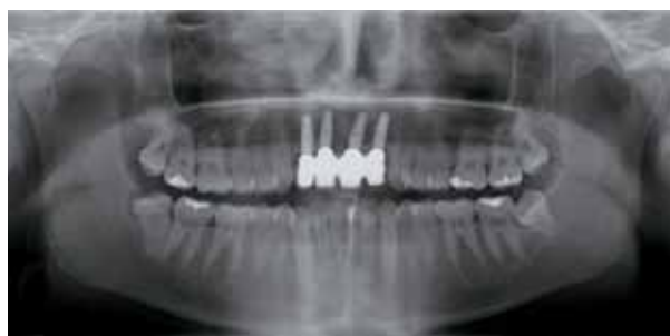
Radiografía panorámica final.