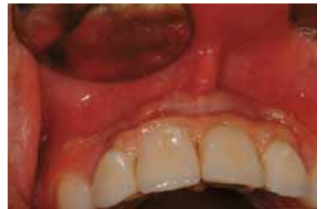
Regeneración ósea obtenida en sentido horizontal.