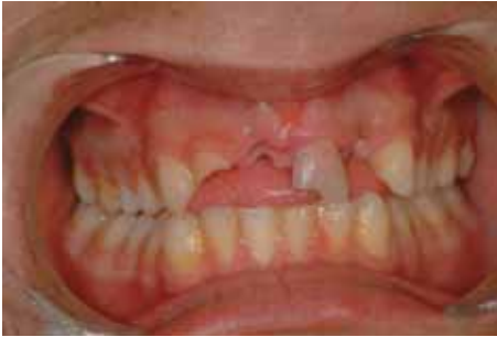
Avulsión del 1.1 y 2.2 y fractura coronal de 1.2 y 2.1.