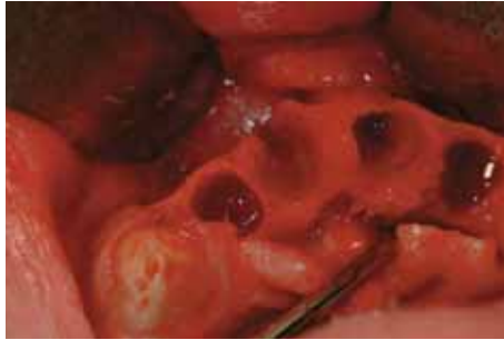
Ausencia de pared vestibular del 1.1.