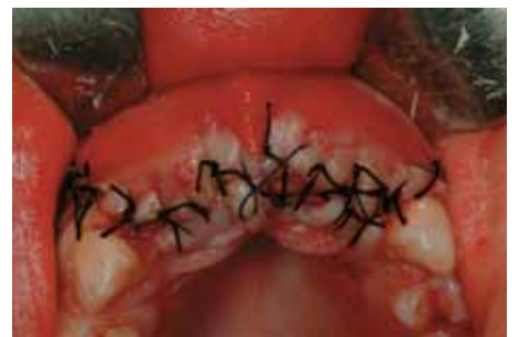
Sutura del relleno alveolar.