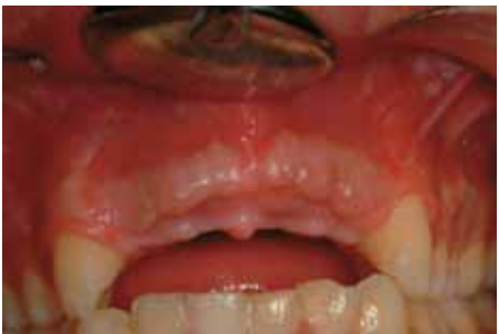
Regeneración del reborde alveolar 5 meses después.