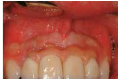
Coronas finales de cerámica en boca.