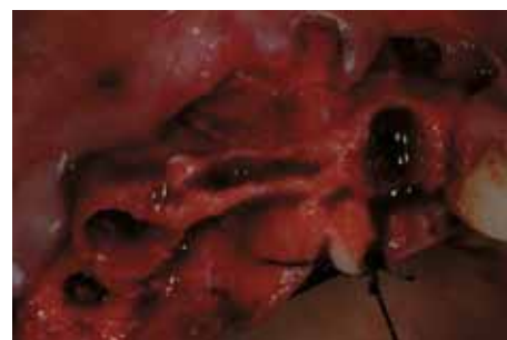
Cortical Split del hueso y ensanchamiento con osteótomos.