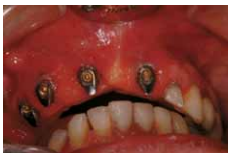
Hueso regenerado después de 6 meses de cicatrización junto a pilares definitivos en boca.