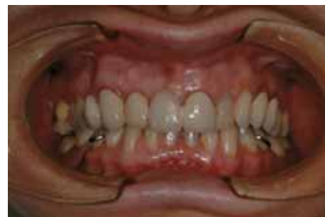
Puente superior inicial en boca.