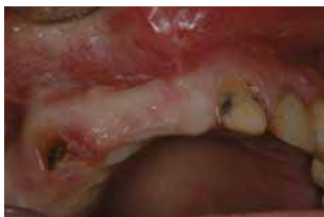
Imagen oclusal donde se observa pérdida ósea en sentido horizontal.