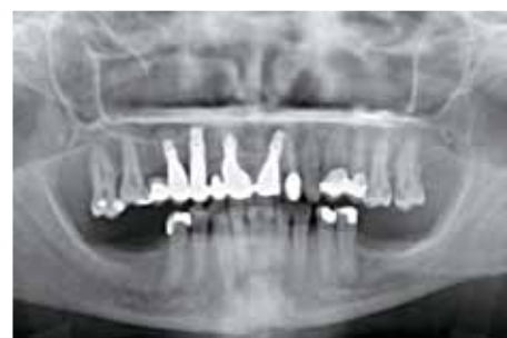
Ortopantomografía final a 7 meses de control.