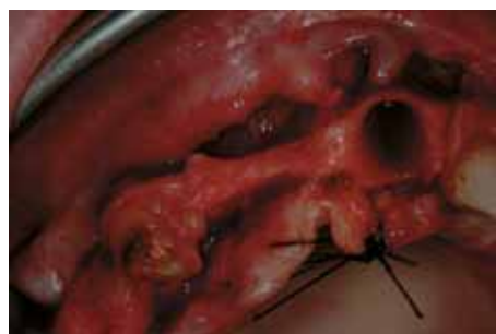
Atrofia del reborde alveolar superior derecho.