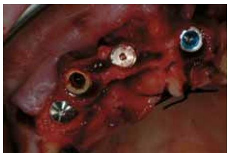
Colocación de 4 implantes en la zona intervenida.