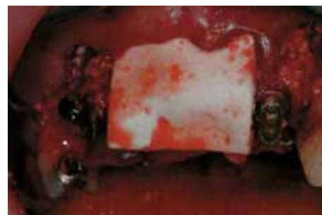
Membrana OsteoBiol Duo-Teck cubriendo el injerto óseo.