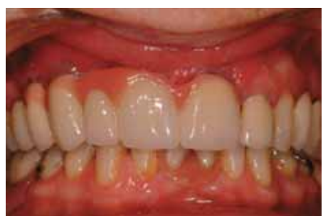
Restauración de cerámica sobre metal final en boca.