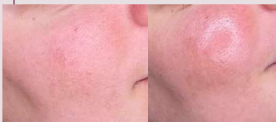
Rejuvenecimiento: antes y después con luz roja y nir. Tratamiento de 1 sesión durante 1 día.