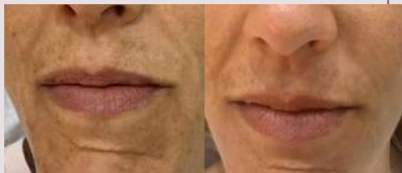
Pigmentación: antes y después con luz roja. Tratamiento de 6 sesiones durante 3 semanas.