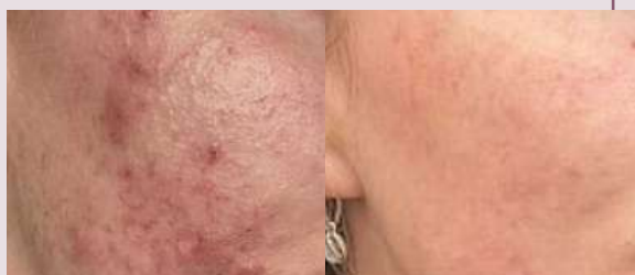
Acné: antes y después con luz azul y nir. Tratamiento de 12 sesiones durante 12 semanas.