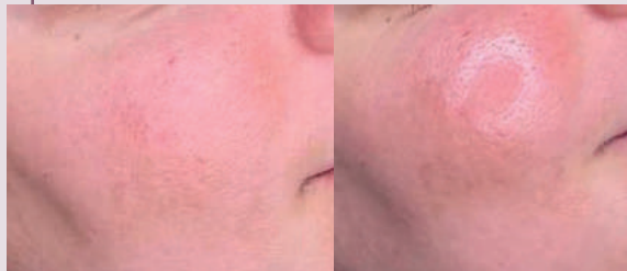
Rejuvenecimiento: antes y después con luz roja y nir. Tratamiento de 1 sesión durante 1 día.