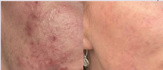
Acné: antes y después con luz azul y nir. Tratamiento de 12 sesiones durante 12 semanas.