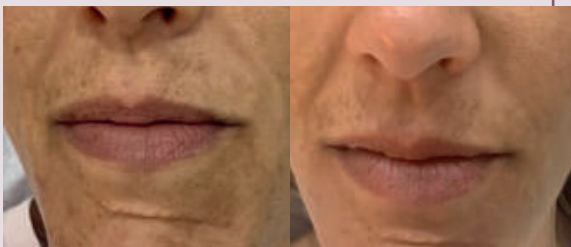
Pigmentación: antes y después con luz roja. Tratamiento de 6 sesiones durante 3 semanas.